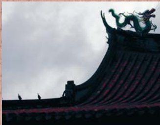
Pedro Hiller – Quenzhou, China, 2002