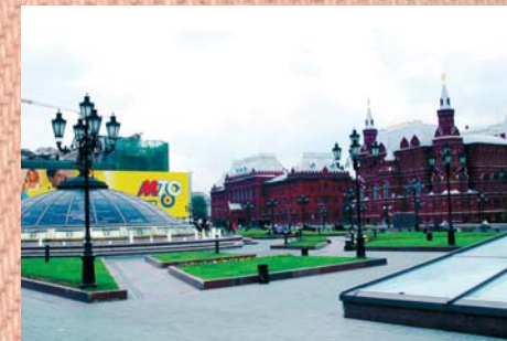
Renata del Soldato

Prédio stalinista ao lado da Praça Vermelha - Moscou, URSS, 1991