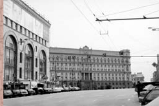
Renata del Soldato – Moscou, Rússia, 2004