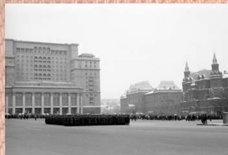
Renata del Soldato

Prédio stalinista ao lado da Praça Vermelha - Moscou, URSS, 1991