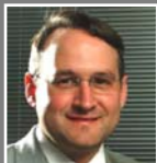
Oskar Kedor Mobility

Detalhes importantes para uma locação de alto nível, garantindo a satisfação.