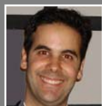
Felipe Silva Hotel Emiliano

A linha da expectativa esperada e o que fazer para alcançá-la e possivelmente, superá-la.